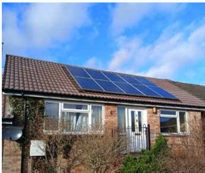
New solar panels